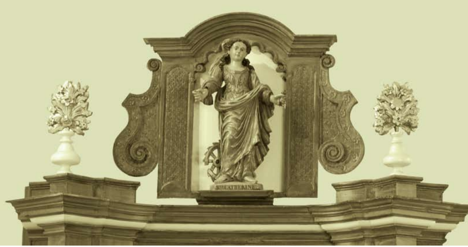
Statuette de sainte Catherine

La toiture et le plafond sont alors restaurés.