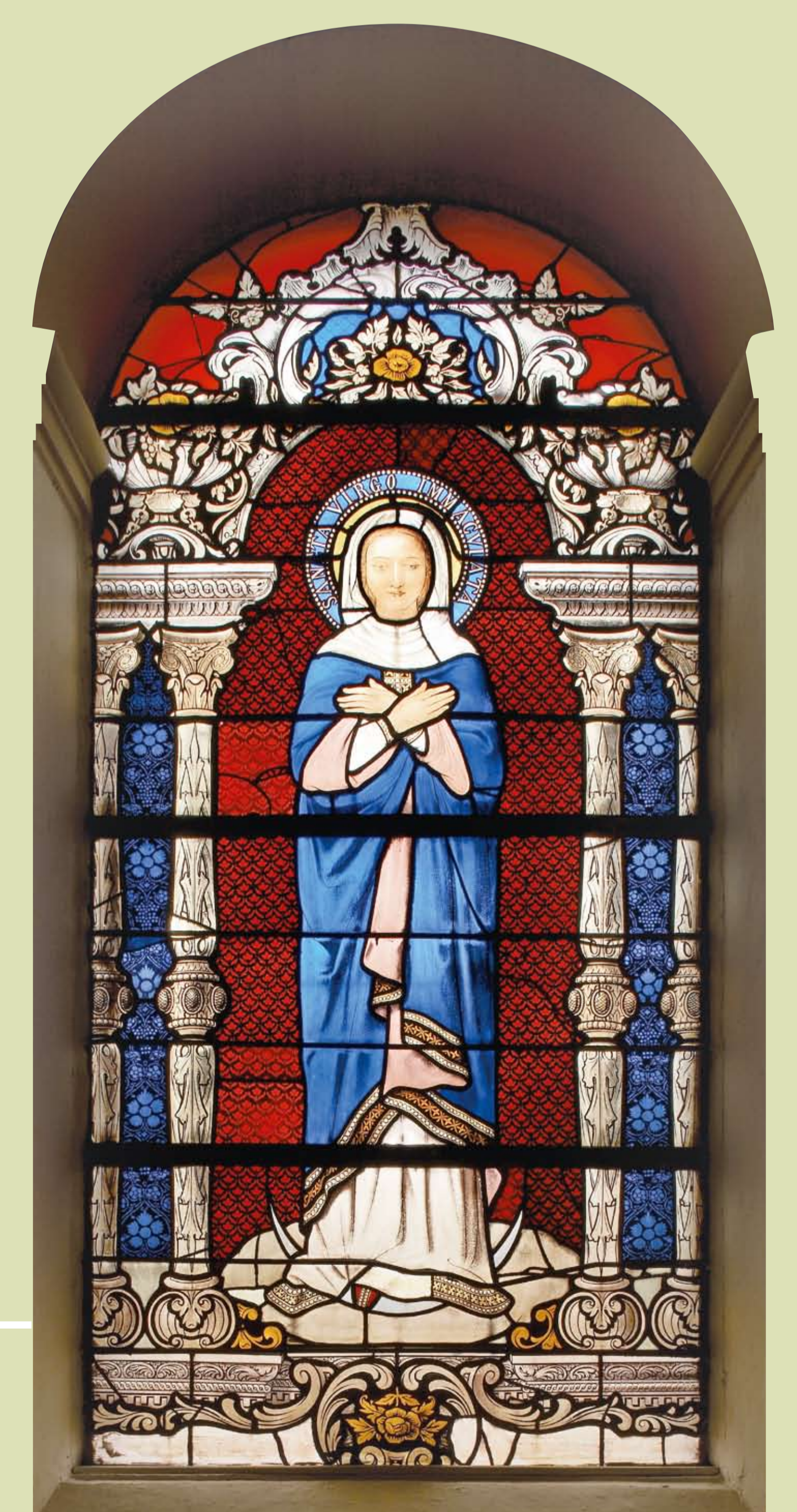
Vitrail : l'Immaculée Conception