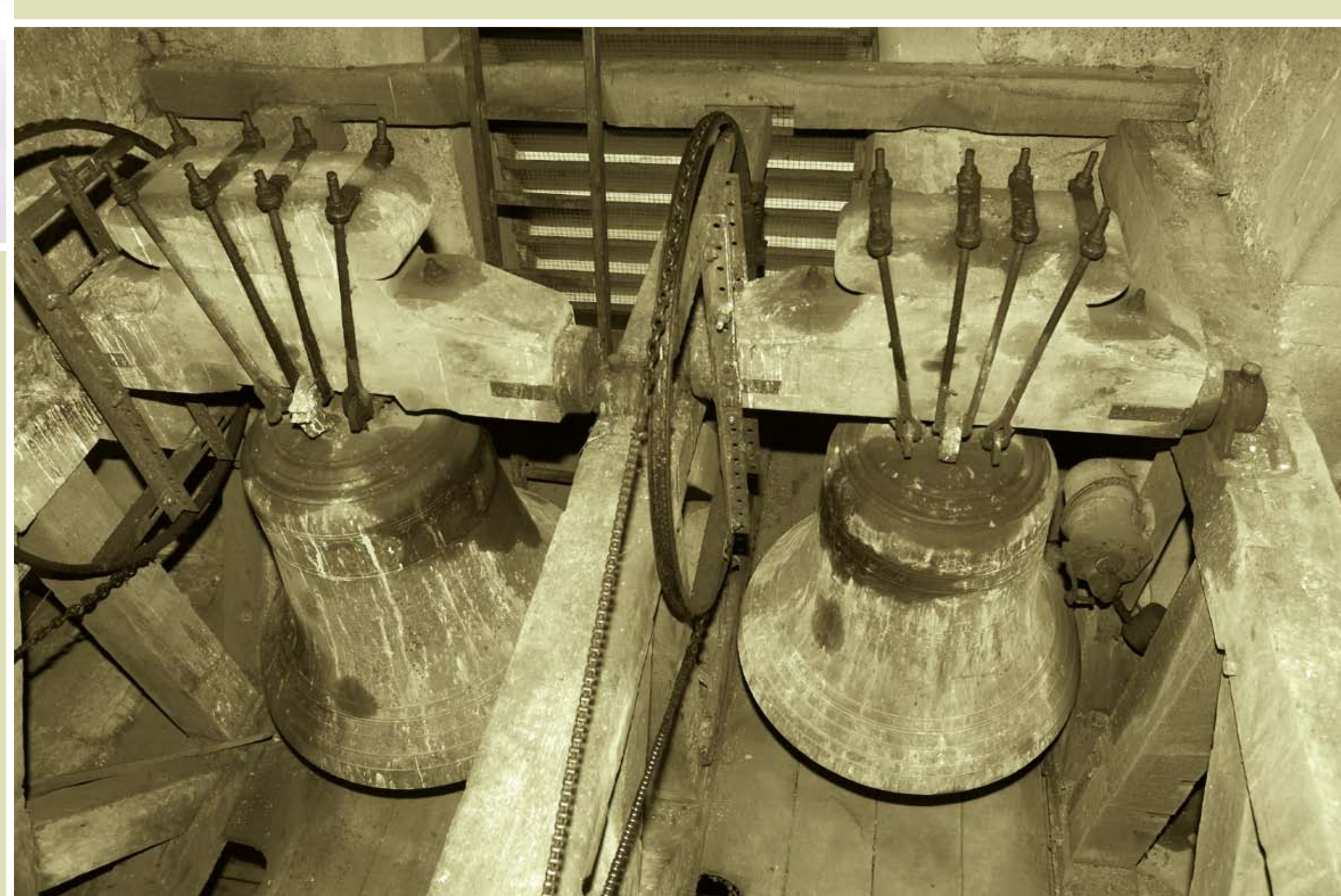
Cloches de Cornille Havard, 1925