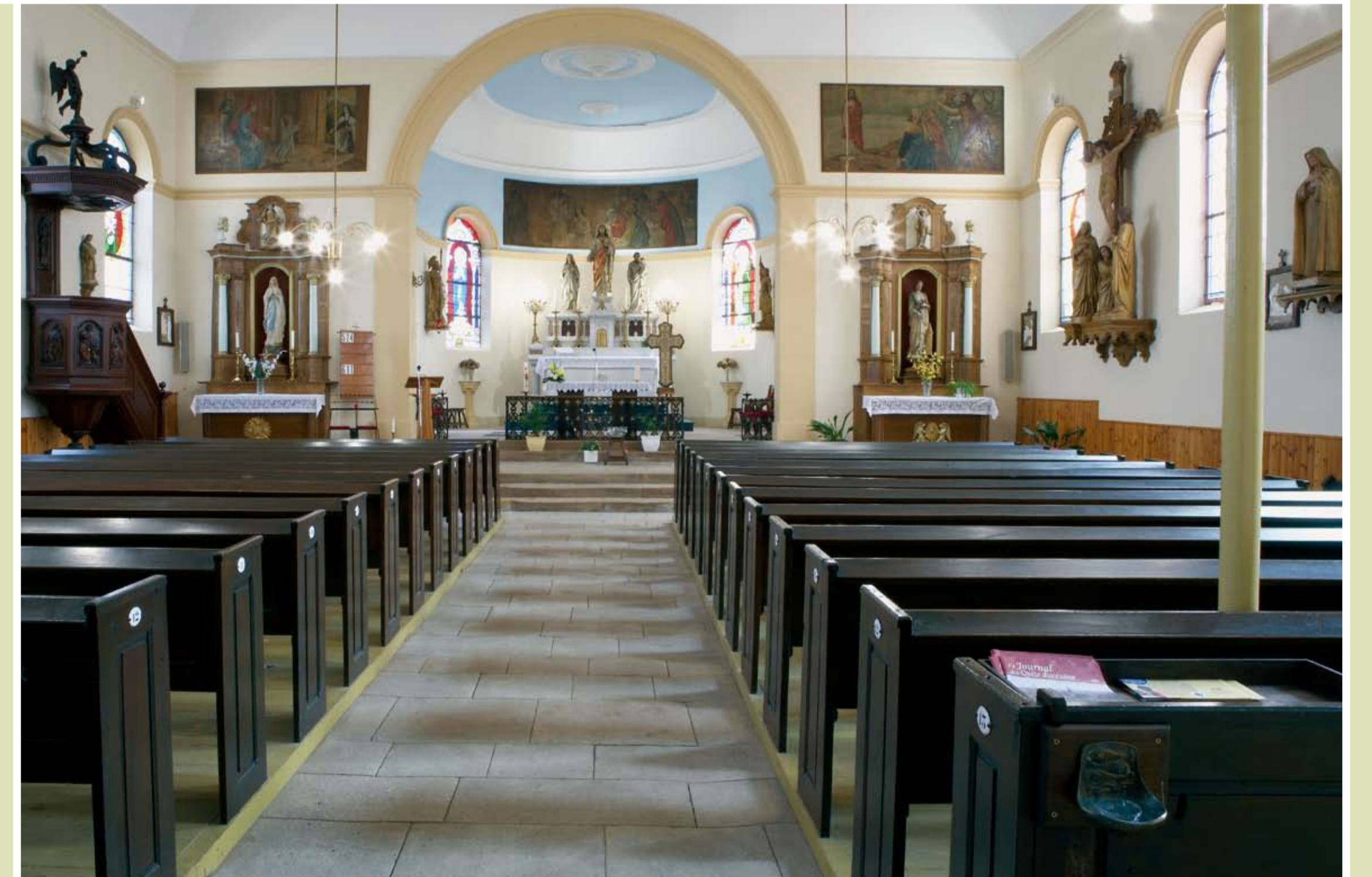
Vue intérieure depuis l'entrée

En 2001, les peintures intérieures sont restaurées.