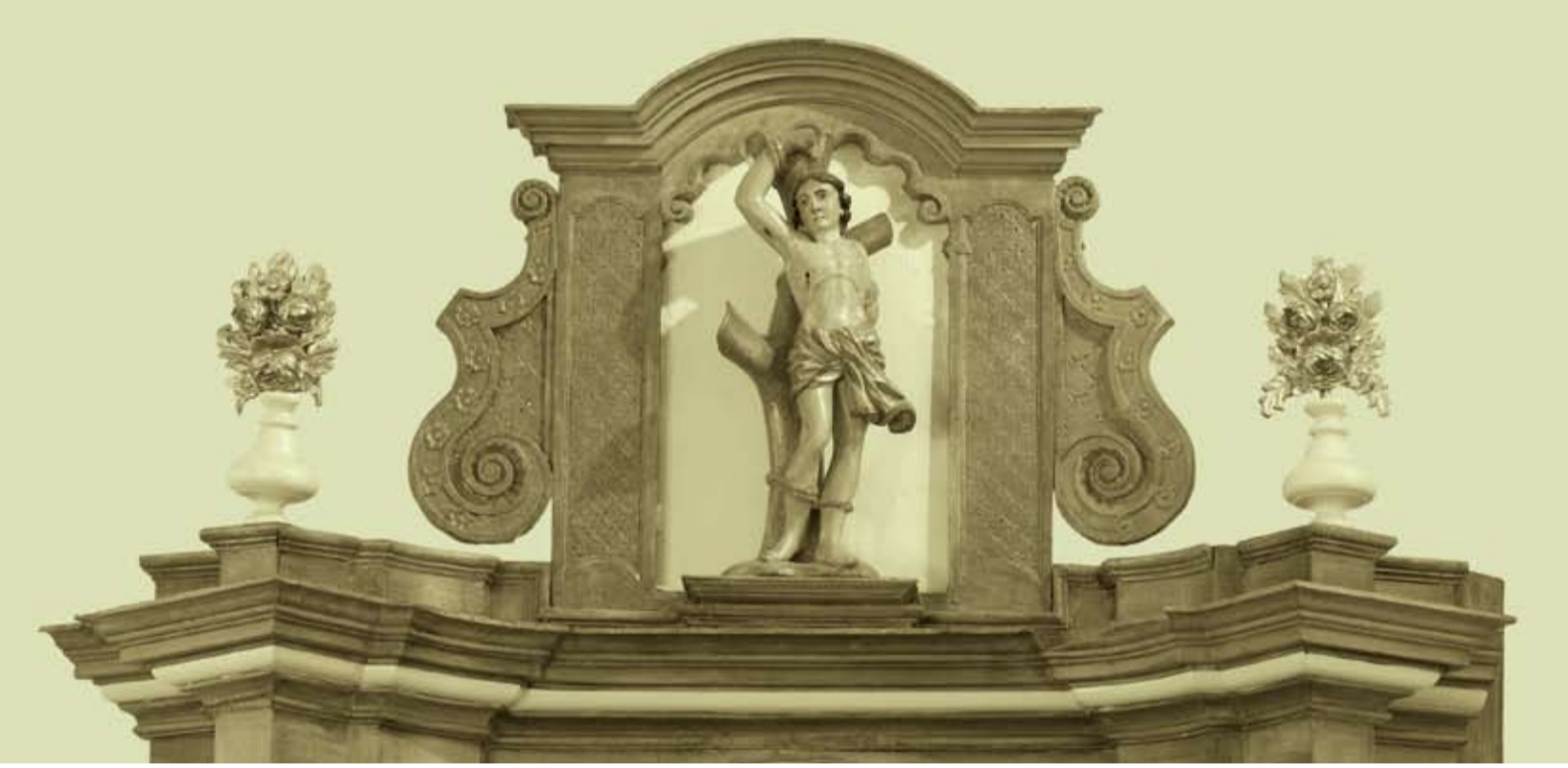
Statuette de saint Sébastien

En juillet 1930, d'urgents travaux de restauration sont entrepris, cinq peintures murales sont réalisées